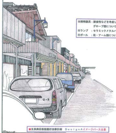
■五泉商店街街路灯改修計画 DesignAイメージベース全景

※照明器具：耐食性などを考慮してALまたはSUS材。 グローブ類については、安全性を考慮し樹脂性。 ※ランプ：セラミックメタルハイドランプ70w~100w程度。 ※ポール：柱・アーム類については、亜鉛めっき指定色仕上げ。